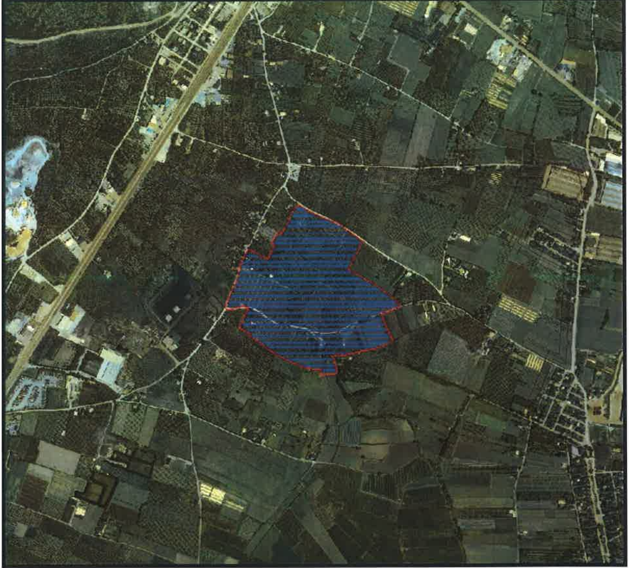
Şekil 1:Planlama Alanının Bölge İçerisindeki Konumu

Bursa İli, Orhangazi İlçesi, Hürriyet Mahallesi içinde bulunan 203291,00 m 2 büyüklüğünde olan planlama alanı , Eski Bursa-Orhangazi yolunun güneydoğusunda , yeni açılan Bursa-Orhangazi yolunun kuzeyinde bulunmaktadır.