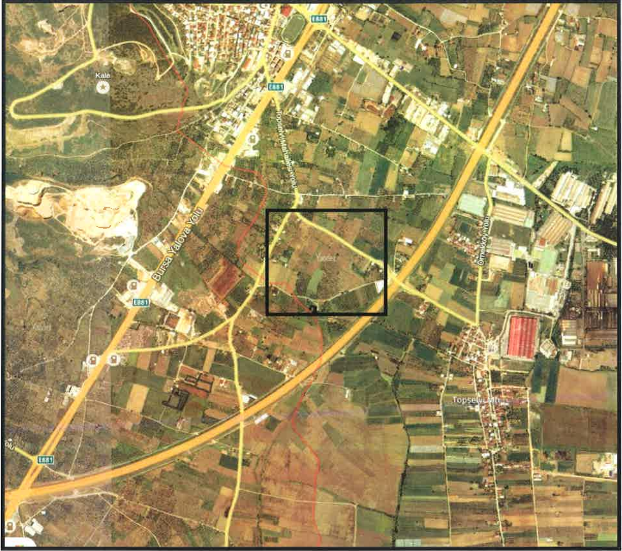
Şekil 2:Planlama Alanının Ulaşım İlişkileri